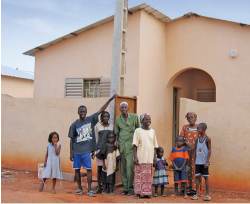
► GRÂCE À UN PRÊT ACCORDÉ PAR SA CAISSE, CE PÈRE DE FAMILLE A PU CONSTRUIRE UNE MAISON.