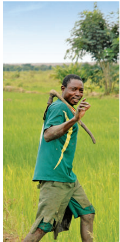
► PRODUCTEUR DE RIZ AU BURKINA FASO

Une autre des caractéristiques de ce réseau est sans conteste la place qu'y occupent les femmes. Celles-ci représentent 61 % de son effectif de 850 employés et 57 % de la clientèle de l'institution. De plus, la National Union leur fait une large place dans les postes stratégiques puisque 51 % des cadres du réseau sont des femmes.