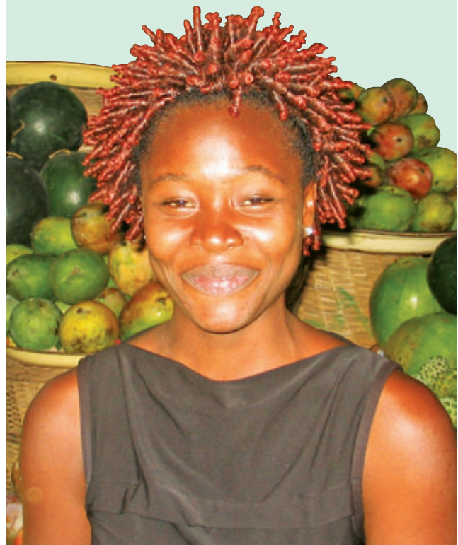
► COMMERÇANTE DE PRODUITS MARAÎCHERS À LOMÉ, AU TOGO

En 2007, DID appuyait directement 1 749 caisses au sein de 22 institutions partenaires. Ensemble, ces caisses desservent 4,1 millions de familles et d'entrepreneurs, emploient 5 329 personnes au sein de leurs communautés respectives et bénéficient de l'appui de 8 664 dirigeants qui œuvrent bénévolement au sein des conseils d'administration de ces institutions. Ces caisses cumulent un actif total de près de deux milliards $ CAN.