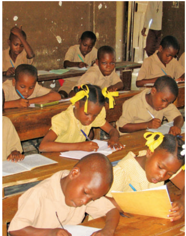
► EN HAÏTI, LE CRÉDIT ÉCOLAGE OFFRE AUX PARENTS LES MOYENS FINANCIERS NÉCESSAIRES À L'ÉDUCATION DE LEURS ENFANTS.

La création, en juin 2007, de la Fédération des caisses populaires haïtiennes Le Levier permettra de diffuser plus largement encore le crédit écolage, qui a jusqu'ici été offert uniquement dans certaines régions d'Haïti, puisqu'elle favorisera l'harmonisation de l'offre de service des caisses d'un bout à l'autre du pays.