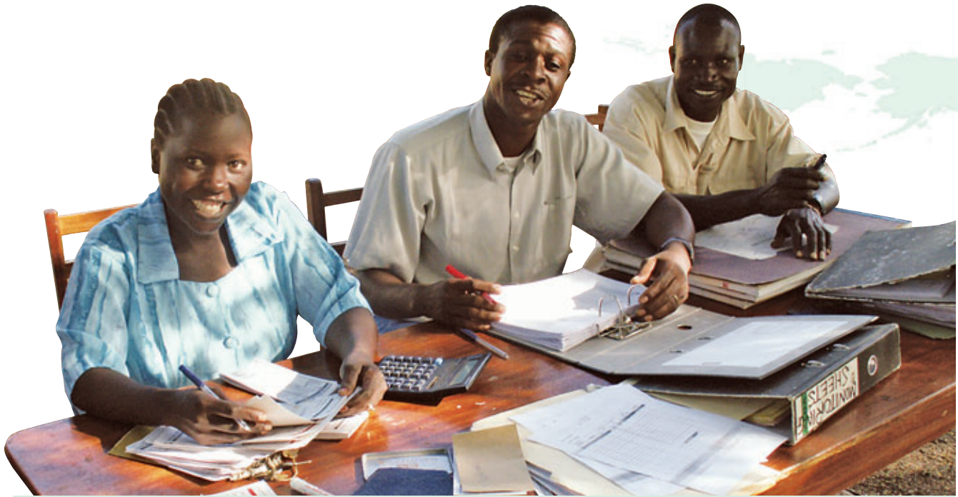
► LA FORMATION DES EMPLOYÉS ET DIRIGEANTS CONTRIBUE À LA PÉRENNITÉ DES CAISSES.