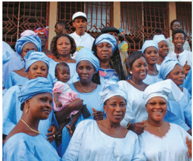
► CES FEMMES PARTICIPENT À L'ASSEMBLÉE GÉNÉRALE ANNUELLE DE LA CAISSE DONT ELLES SONT MEMBRES À CONAKRY, EN GUINÉE.

Au Sénégal, le réseau PAMÉCAS est une institution financière mature et bien implantée, dynamique et performante. L'institution affiche un rendement sur actif de 7 % ainsi qu'une autosuffisance financière et opérationnelle avoisinant les 200 %. Sa préoccupation quant à la sécurité de l'épargne de ses 330 000 membres-clients a par ailleurs contribué à maintenir les retards sur les crédits à un très bas niveau. Le portefeuille à risque (90 jours) avoisine en effet les 4 %, ce qui laisse voir que les bons résultats de PAMÉCAS sont atteints sur une base durable. Sa capitalisation s'élève à 25 %, et ses 37 caisses affichent un actif total de 64 millions de dollars. Sachant que le PIB par habitant dans ce pays d'Afrique de l'Ouest n'est que de 600 $ CAN, ces chiffres ont de quoi impressionner !