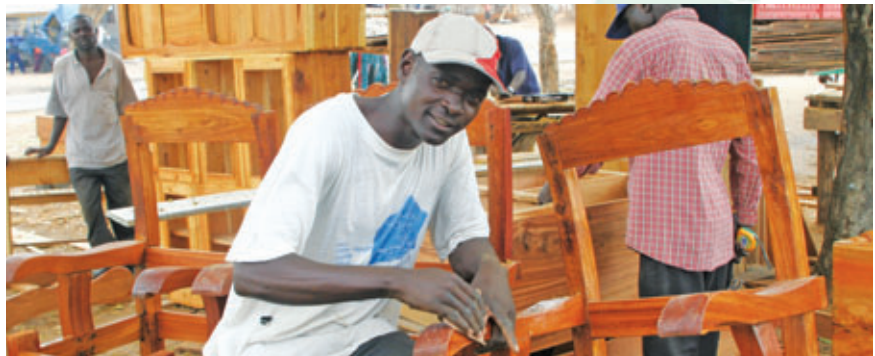
► LE CENTRE FINANCIER AUX ENTREPRENEURS (CFE) SOUTIEN LA RÉALISATION DE PROJETS D'AFFAIRES GRÂCE À DU FINANCEMENT ADAPTÉ AUX BESOINS DES MICRO-ENTREPRENEURS.

Les CFE sont en mesure d'offrir des produits et services conçus spécifiquement pour les entrepreneurs, de manière à les accompagner tout au long de l'évolution de leur entreprise. Ils constituent bien souvent la bouffée d'oxygène dont les entrepreneurs avaient besoin pour aller de l'avant et sont donc autant de leviers essentiels de développement du secteur privé.