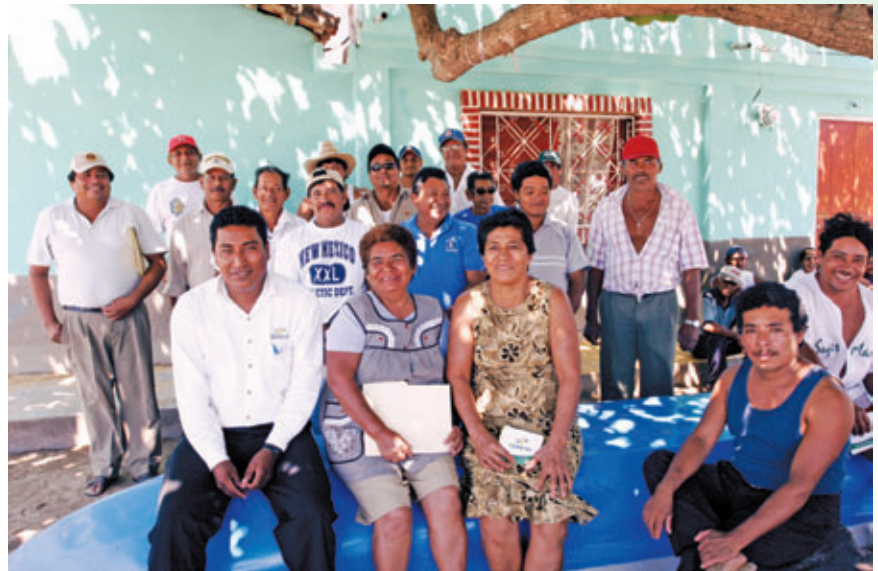
► MEMBRES DE LA CAISSE DE TONALA, DANS L'ÉTAT MEXICAIN DU CHIAPAS.

Ensemble, ces institutions joignent plus de 50 000 membres, dont 56 % sont des femmes et 71 % vivent en milieu rural. Celles de Chiapas et Huasteca ont déjà atteint l'autosuffisance financière tandis que la dernière née, dans l'état de Puebla, est en progression régulière à ce chapitre.