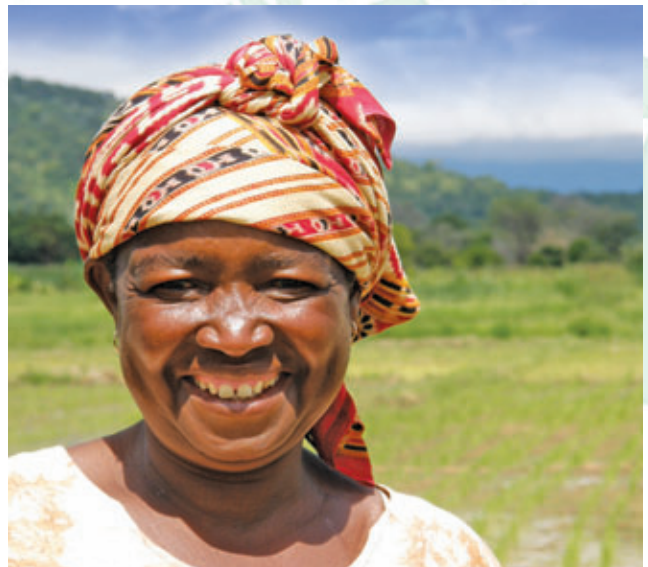
► EN TANZANIE, LE CRÉDIT ACCORDÉ À CETTE AGRICULTRICE PERMET UNE PLUS GRANDE AUTONOMIE FINANCIÈRE POUR ELLE ET SA FAMILLE.

C'est dans cette perspective que DID et ses partenaires du Burkina Faso, de Madagascar, de Tanzanie et du Mexique ont élaboré des produits financiers associés aux diverses étapes du travail agricole. Ces produits visent à faciliter l'achat d'équipement et d'intrants, comme l'engrais et les semences, à permettre l'entreposage sécuritaire des récoltes en attendant d'obtenir un meilleur prix de vente, à favoriser la transformation des produits, tout particulièrement par des femmes, afin d'ajouter de la valeur à la production agricole et de générer ainsi des revenus additionnels, et même à financer l'exportation de produits liés au commerce équitable.