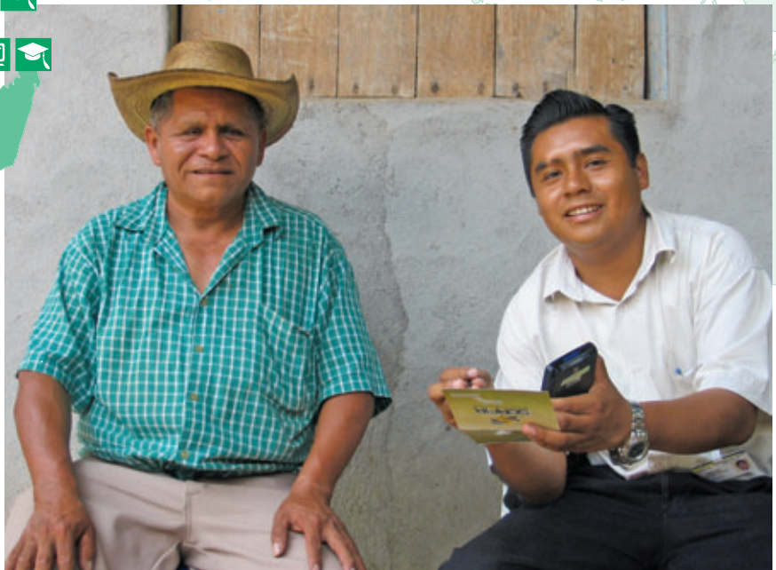
► AU MEXIQUE, LA POPULATION RURALE PEUT AUSSI AVOIR ACCÈS À DES SERVICES FINANCIERS SÉCURITAIRES GRÂCE À LA TECHNOLOGIE DE POCHE UTILISÉE PAR LES EMPLOYÉS DES CAISSES SERFIR.

De plus, les agents de crédit peuvent utiliser cet outil pour aller rencontrer les membres là où ils se trouvent. Grâce à l'AMIO, quelque 500 000 individus peuvent désormais effectuer leurs transactions de façon rapide et sécuritaire, et ce, à même leur lieu de travail ou de résidence.